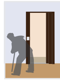
④ 最寄り階で停止し乗客避難後戸閉止

約 40 秒後に通常運転に復帰します（大きな揺れ来た場合は継続休止となりますので専門技術者へご連絡ください）