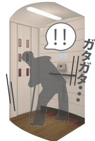
③ 地震管制運転モードに切り替え